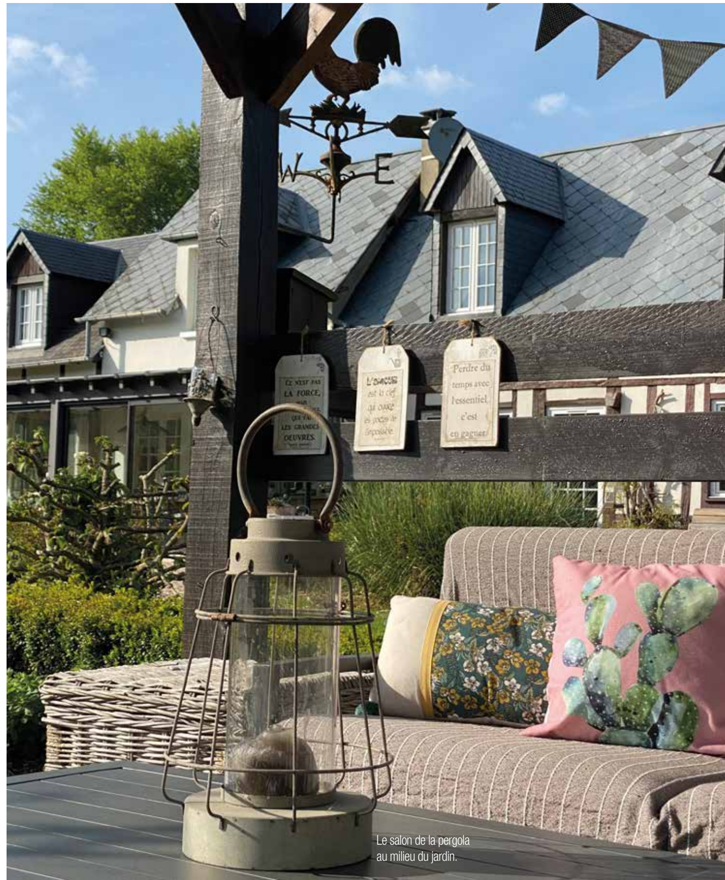
Le salon de la pergola au milieu du jardin.