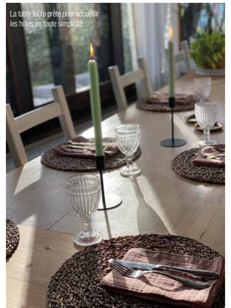
La table toute prête pour accueillir les hôtes en toute simplicité.