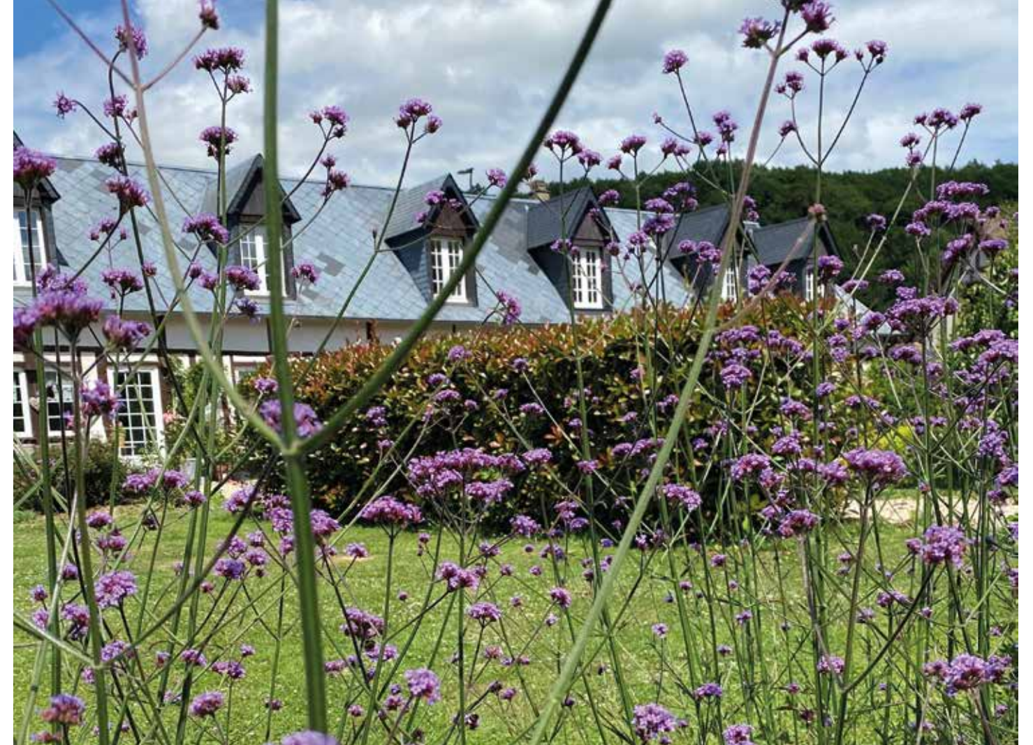
Ci-dessus : La Verbena en fleur donne un rideau violet au bord de la rivière qui coule au milieu du jardin

Reportage : Michel Herman - Photos : propriétaires