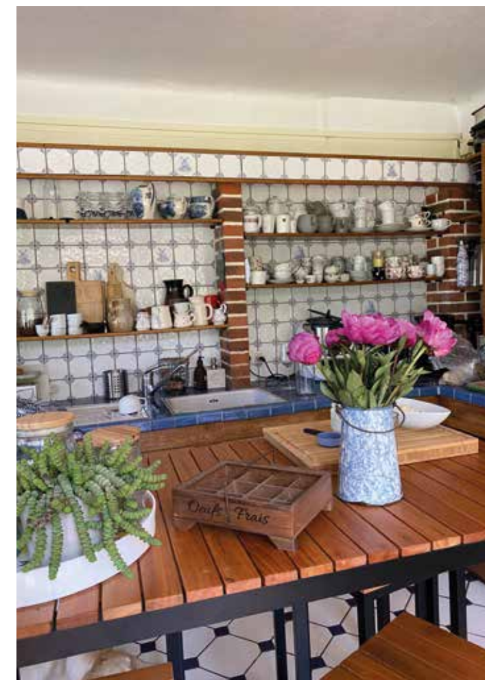
Ci-dessous : La magnifique cuisine, là où Katia prépare les petits déjeuners maisons, les planches d'inatoires et les tables d'hôtes.