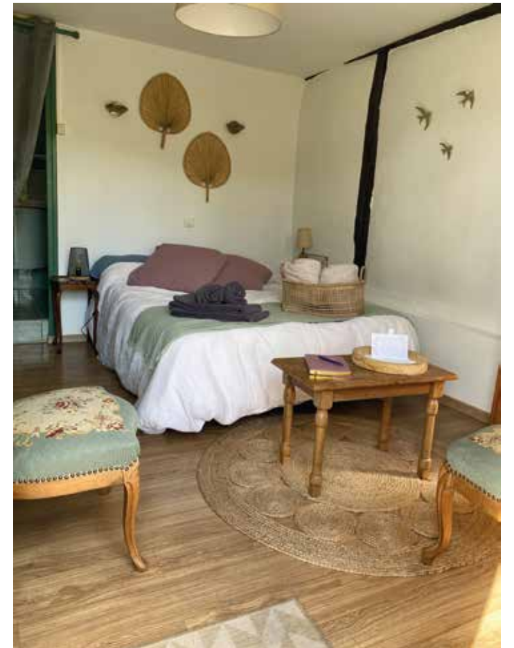
Ci-contre : La chambre verte pouvant accueillir jusqu'à deux personnes.

“ Au coeur de la Normandie, historiquement si féconde, aux portes de Rouen, dans ce ravissant département de l'Eure