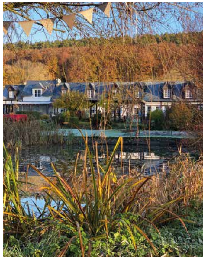
Ci-contre : Focus sur les oiseaux de la longère et l'entrée d'une chambre.