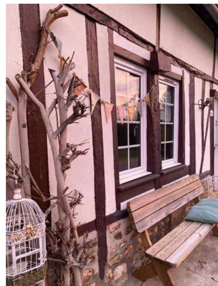
Ci-dessous : La glycine taillée et le banc contre la longère.