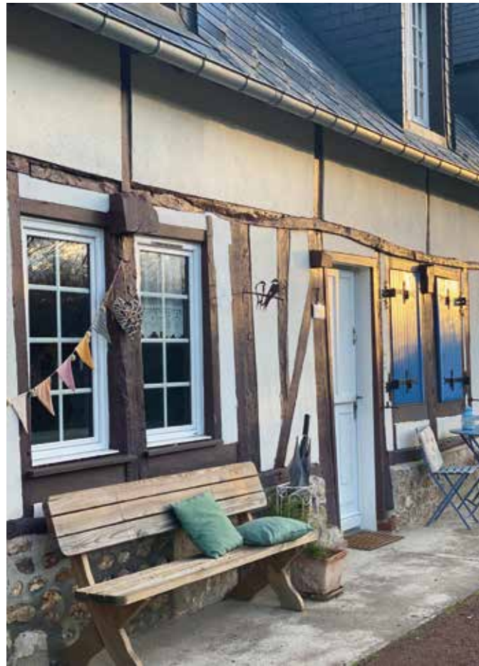
Ci-dessus : Arrêt sur le banc à côté de la chambre bleue qui permet d'admirer le jardin.