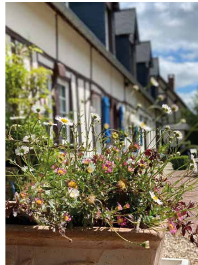
Les fleurs d'été devant la longère.