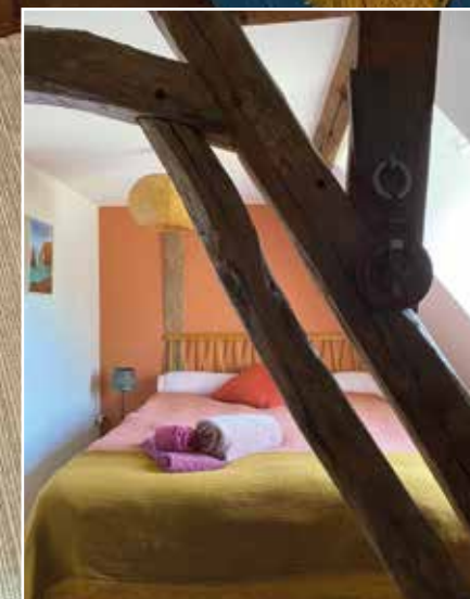
Ci-contre : Le grand lit de la chambre « terracotta », laquelle peut accueillir jusqu'à huit personnes. Celle-ci comprend, outre la salle de bains et les sanitaires, un salon et une cuisine.