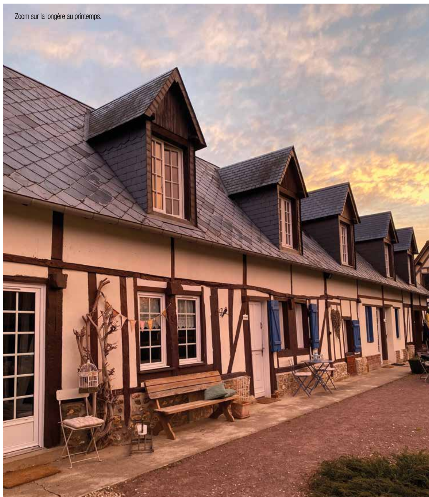
Zoom sur la longère au printemps.