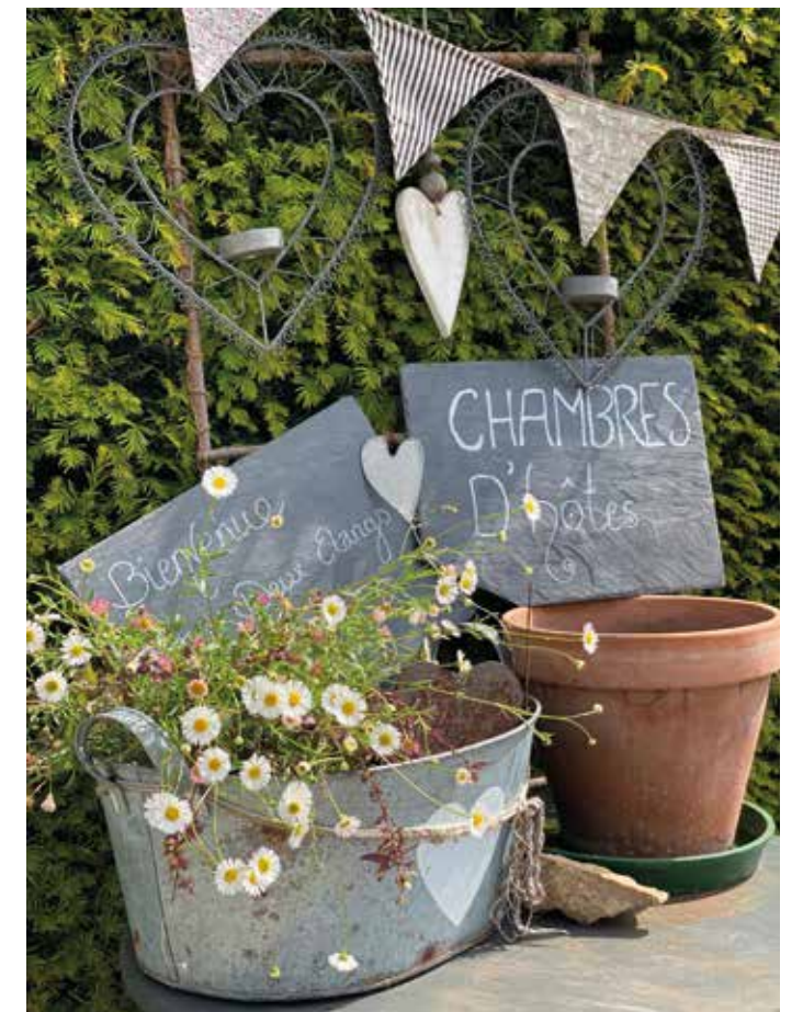
L'accueil visible juste devant la maison souhaitant la bienvenue aux hôtes